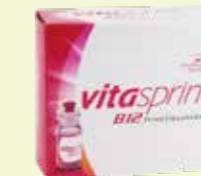
vitasprint B12 Trinkfläschchen* 30 Trinkfläschchen