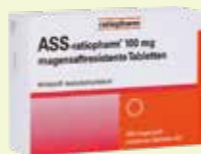
ASS-ratiopharm 100 mg magensaftresistente Tabletten* 100 Tabletten