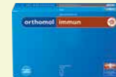
orthomol immun Granulat 30 Tagesportionen