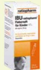
IBU-ratiopharm 4% Fiebersaft für Kinder* 100 ml