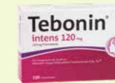
Tebonin intens 120 mg* 120 Filmtabletten