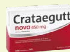
Crataegutt novo 450 mg* 100 Filmtabletten