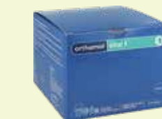
orthomol vital f 30 Tagesportionen