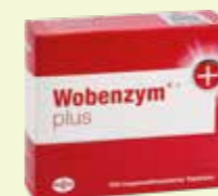
Wobenzym plus* 100 Filmtabletten