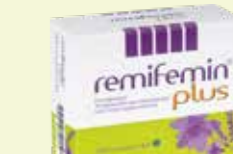
remifemin plus* 100 Filmtabletten