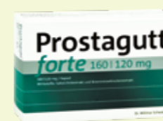
Prostagutt forte 160/120 mg* 120 Kapseln