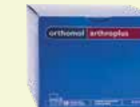
orthomol arthroplus 30 Tagesportionen