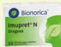
Bionorica Imupret N* 50 Dragees