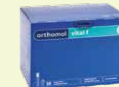
orthomol vital f Trinkfläschchen/Kapsel 30 Tagesportionen