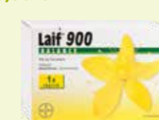
Laif 900 BALANCE* 60 Filmtabletten

Ab sofort erreichen Sie Ihre Apotheke auch per WhatsApp!