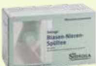
Sidroga Blasen-Nieren-Spültee* 20 Filterbeutel