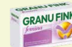
GRANU FINK femina* 60 Kapseln