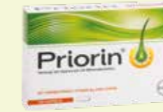
Priorin 120 Kapseln