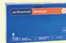
orthomol immun 7 Tagesportionen