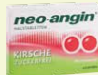
neo-angin HALSTABLETTEN KIRSCH ZUCKERFREI* 24 Lutschtabletten