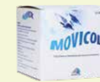
MOVICOL* 50 Beutel