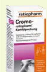
Cromo-ratiopharm Kombipackung Nasenspray und Augentropfen* 1 Kombipackung