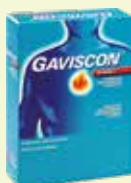
GAVISCON ADVANCE Pfefferminz* 12 x 10 ml