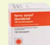
ferro sanol duodenal* 100 Hartkapseln